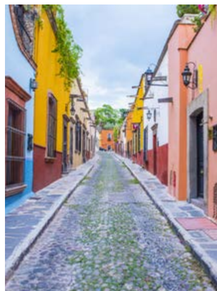
Bunte Häuser in San Miguel de Allende.

Willst du Teotihuacán bei einer Ballonfahrt von oben erleben? Dann sag deinem Reiseleiter nach Ankunft in Mexiko Bescheid! In diesem Fall entfällt für dich der Abstecher zur Basílica de Guadalupe. Die einstündige Tour startet bereits sehr früh am Morgen, damit du den Sonnenaufgang über den Pyramiden genießen kannst.